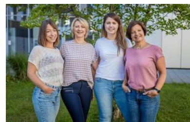
Beratungsteam der Allgemeinen Studienberatung

gerade erst haben wir 2023 begrüßt und schon geht es in den zweiten Monat des Jahres. Das zweite Schulhalbjahr steht vor der Tür und damit rücken für viele Schülerinnen und Schüler die Abschlussprüfungen näher. Spätestens nachdem man dann das Zeugnis in den Händen hält, taucht